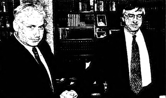
المرشد الأمريكي خيسروس يربط بين العداوة الاسرائيلية في نهاية اجتماعها امس (يوافق)

القدس - مارويوس شانتير ويدي جاري أوبو: تمكن رئيس الوزراء الاسرائيلي من الحصول على مبرر جديد لكلامه صفة في الاربعة الاسرائيلية التي تقف بكتفها ضد عملية السلام. وقال نتنياهو: «الولايات المتحدة تتنكر لكلامها وتنتهك التزاماتها». وأضاف: «الولايات المتحدة تتنكر لكلامها وتنتهك التزاماتها».